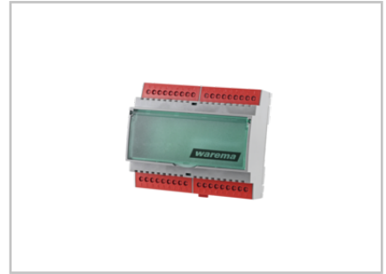
Schaltnetzteil 24 V DC / 2,5 A REG 2024680