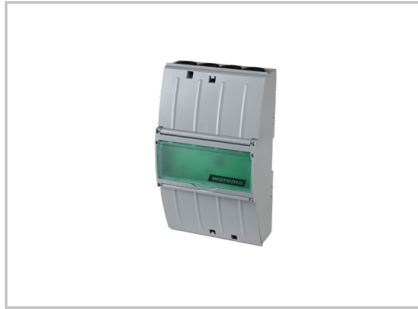
Schaltnetzteil 24 V DC / 2,5 A AP 2024681